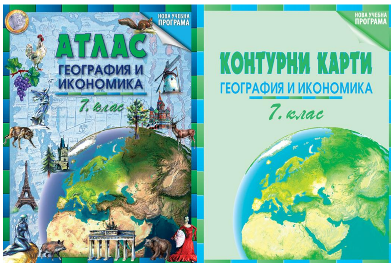
Фиг. 1. Атлас по „География и икономика” за 7 клас [1]

и Контурни карти по „География и икономика” за 7 клас [4]