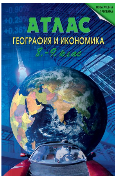
Фиг. 2. Атлас по „География и икономика“ за 8-9 клас [2]