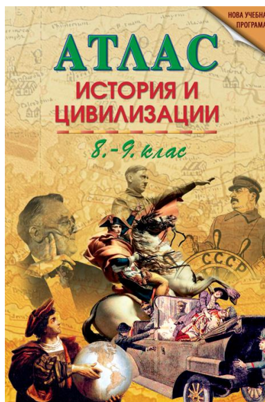
Фиг. 5. Атлас по „История и цивилизация” за 8-9 клас [5]

Атласът [5] разглежда историята на Европа и света от Великите географски открития до началото на XXI век. В 66 бр. карти хронологично са представени най-важните исторически събития, процеси, териториални промени и други факти от разглеждания период. Съдържанието е разделено в 6 теми: Началото на Новото време, XVI-XVII век; Векът на Просвещението, XVIII век; Векът на национализма, XIX век; Балканите през XIX и началото на XX век; Светът от началото на XX век до 1945 г.; Светът след 1945 г. Картите са разработени въз основа на най-новите исторически изследвания и данни, като са използвани ГИС. Автор на атласа в част „История” е гл. ас. д-р Никола Дюлгеров – историк от Софийския университет; автор на част „Картография” -проф. Т. Бандрова.